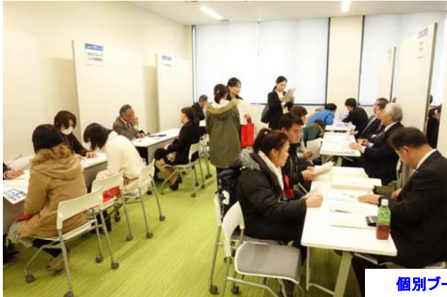
個別ブースのようす