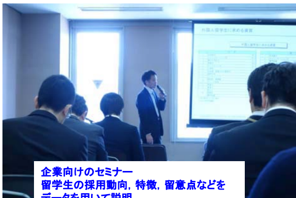
企業向けのセミナー 留学生の採用動向，特徴，留意点などを データを用いて説明 (株)ディスコ御担当