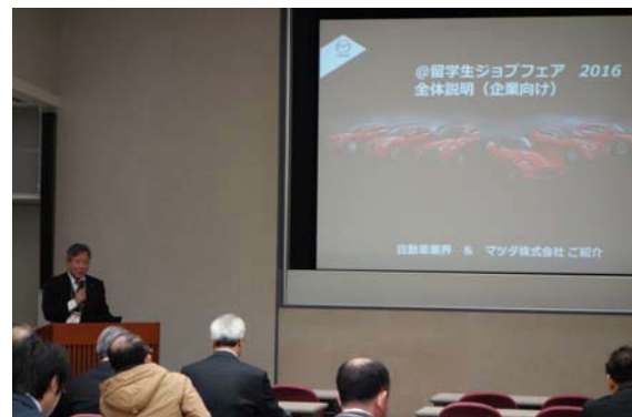
外国人材活用事例の紹介をされる企業御担当