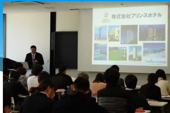
就活の心構えを説く企業の採用御担当